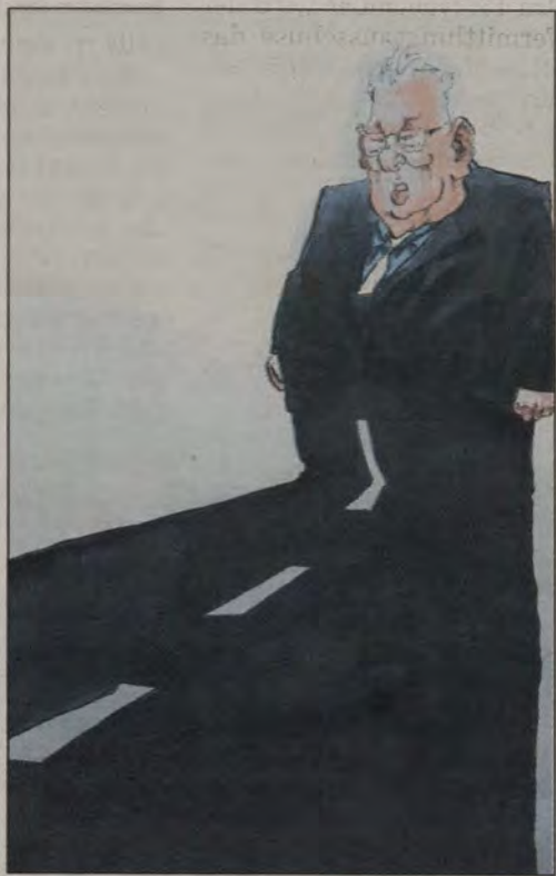
Tidligere trafikminister Kaj Ikkast er ofte blevet beskyldt for at være medlem af den jyske motorvejsmafia.