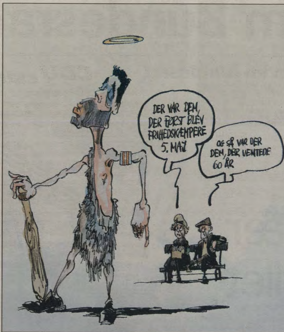
Politikens tegner Roald Als er blevet kendt for sine tegninger af statsminister Anders Fogh Rasmussen som hulemand. Ideen opstod, da Anders Fogh Rasmussen udgav sin ultraliberale bog »Fra socialstat til minimalstat«.

- Tegningerne er jo ikke beregnet til at skulle udstilles. De er lavet for at blive mangfoldiggjort, og det er jo det, vi gør ved at trykke dem i plakatstørrelse,