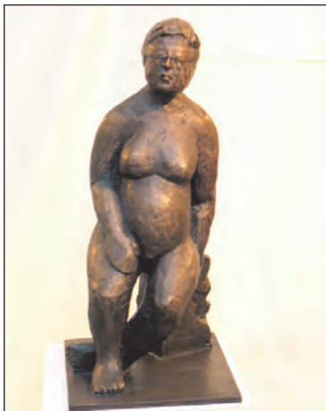
Til venstre: »Gamle Justitia«.