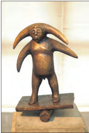
»Trolde på vippe«.