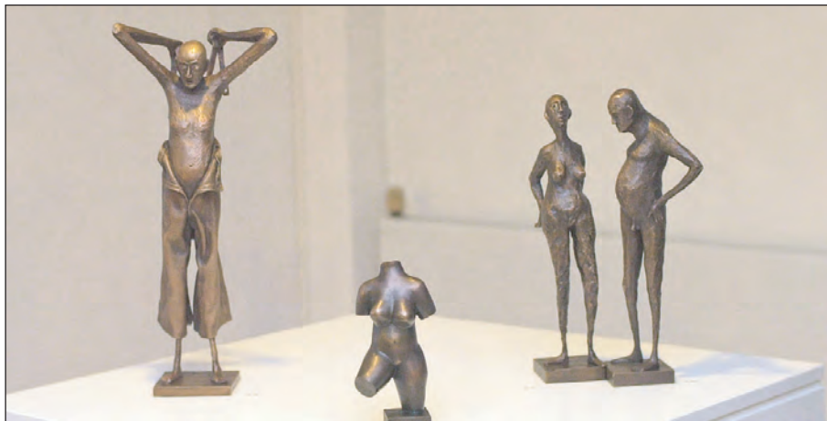
Til højre: »Klovn med bukser«, »Kvin- delig torso«, »Gammel kvin- de« og »Gam- mel mand«.