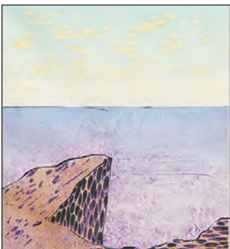
Ovenfor er det to af Marius Olsens billeder med et formsprog, der har sin poesi.