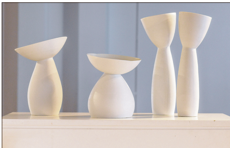
Porcelæn i bevægelse - af Roswitha Winde-Pauls.