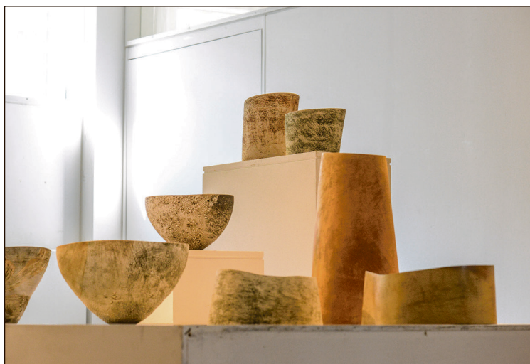
Stentøj - af Susanne Kallenbach.