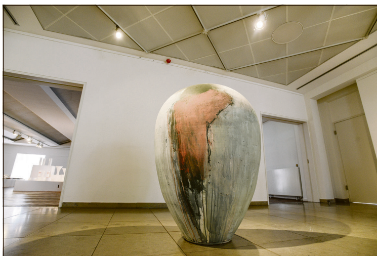
Klassisk krukke i stort format - af Jean-François Thiérion.