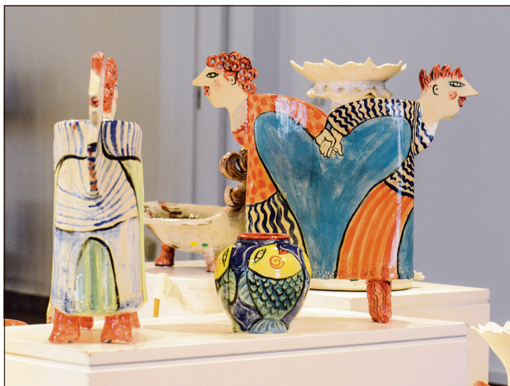
Dagligdagens livsglæde - af Katrin Schober.