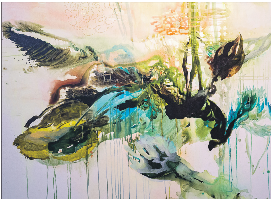
Farver, former og linjer lever helt deres eget liv i Inka Sigels malerier.