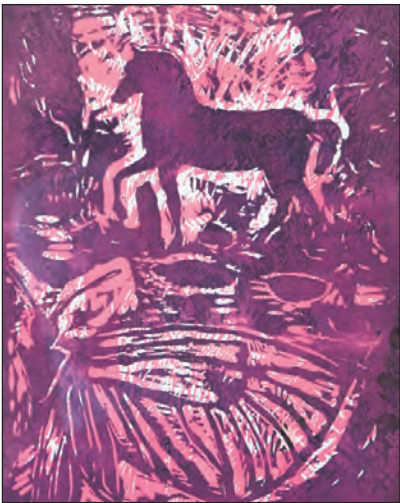
Inspiration fra Markuspladsen i Venedig – af Viggo Børnsen-Jensen.

Han byder på store malerier med fuld knald på både farverne og det sorte og hvide. Det vrirler med får, men det er ikke fåret som sådan, han interesserer sig for. Dyret med de rundne, uldne former er blot et middel til at få sat en akkord og derfra spinde videre med noget helt andet. Inspirationen er generelt kirkekunst, men