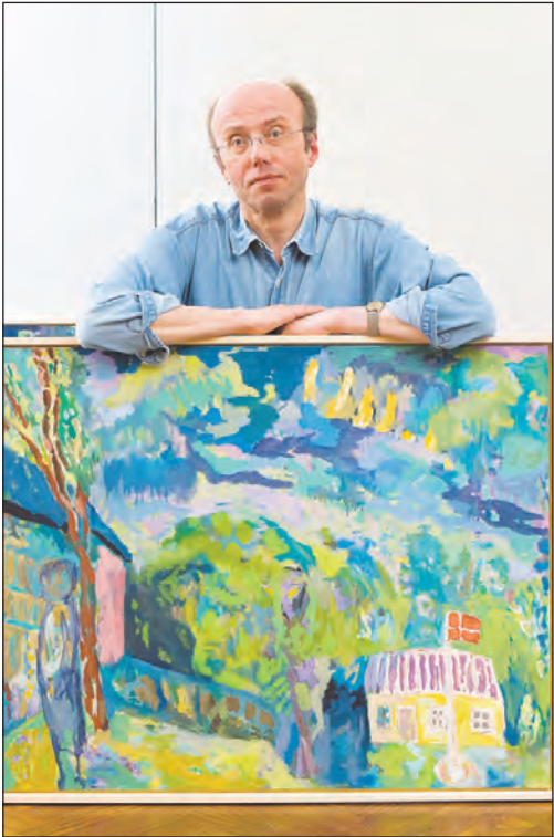
Lange streger og et hus fra barndommens erindring – af Viggo Børnsen-Jensen.