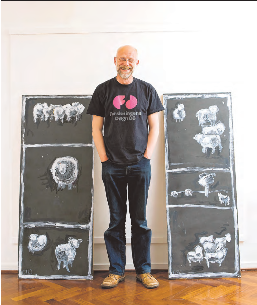
Sorte tavler, rå og vilde – af Gunnar Børnsen Jensen.