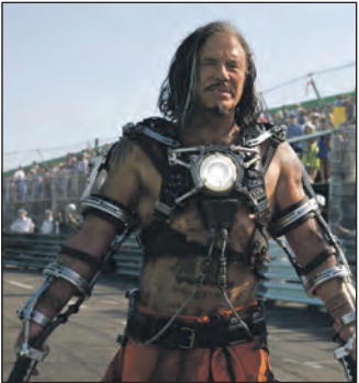
Iron Man 2.

Kosmorama, Haderslev AN EDUCATION fredag-onsdag kl. 18. lørdag-søndag også kl. 16. IRON MAN 2 fredag-onsdag kl. 20. lørdag-søndag også kl. 16. torsdag kl. 20.45. DATE NIGHT fredag-tirsdag kl. 20.30. PRECIOUS fredag-onsdag kl. 18.30. KARLA OG JONAS lørdag-søndag kl. 14. SÅDAN TRÆNER DU DIN DRAGE lørdag-søndag kl. 14.15. ROBIN HOOD torsdag kl. 14.15, 17.15 og 20.15. DET HVIDE BÅND torsdag kl. 18.