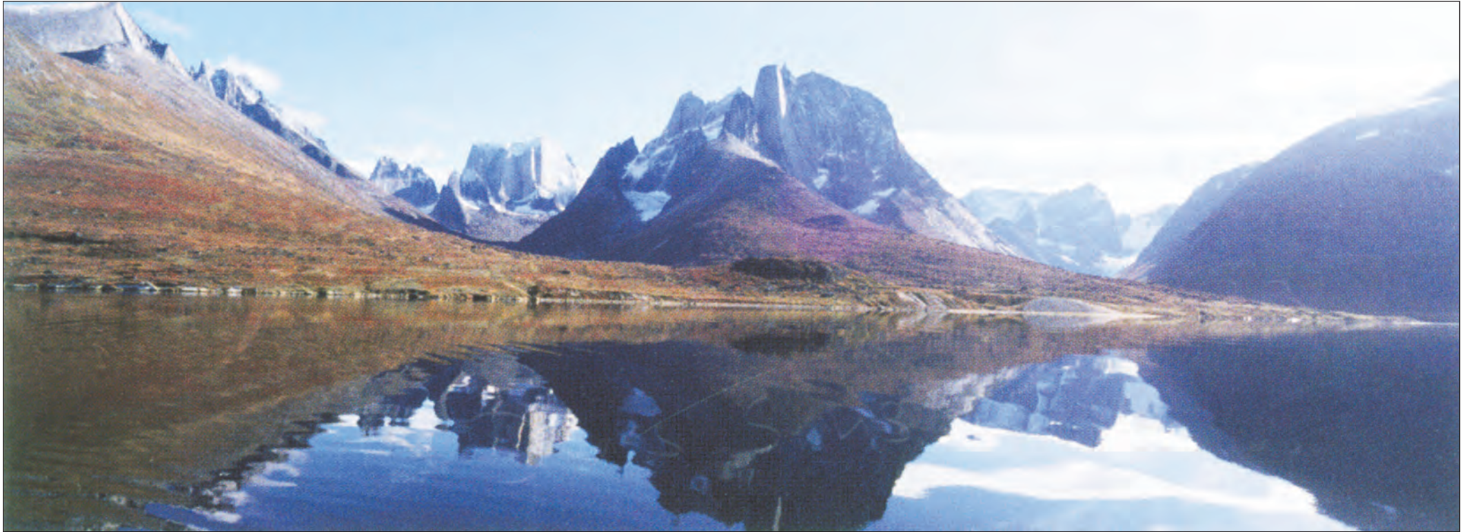
Ivars Silis kommer en del rundt i den grønlandske natur. Billedet her er fra Tasermiut, men familiens fader har også en række grønlandske portrætter i sort-hvid med til Slesvig.