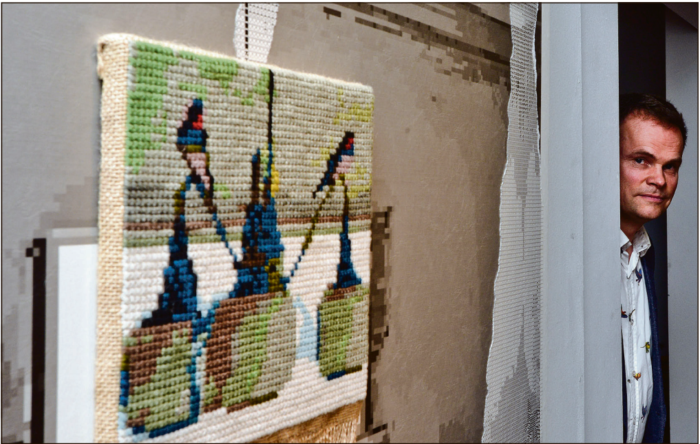
Thomas Wolsing beskæftiger sig med landskab og randområder i udkantsdanmark - på stramajbroderi.