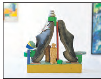
Kunstnerens gamle træsko, som han gik i på akademiet.