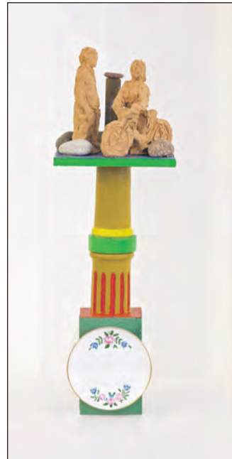
Skulpturerne er ikke dem, der fylder mest på udstillingen i Flensborg – men her er en af dem.