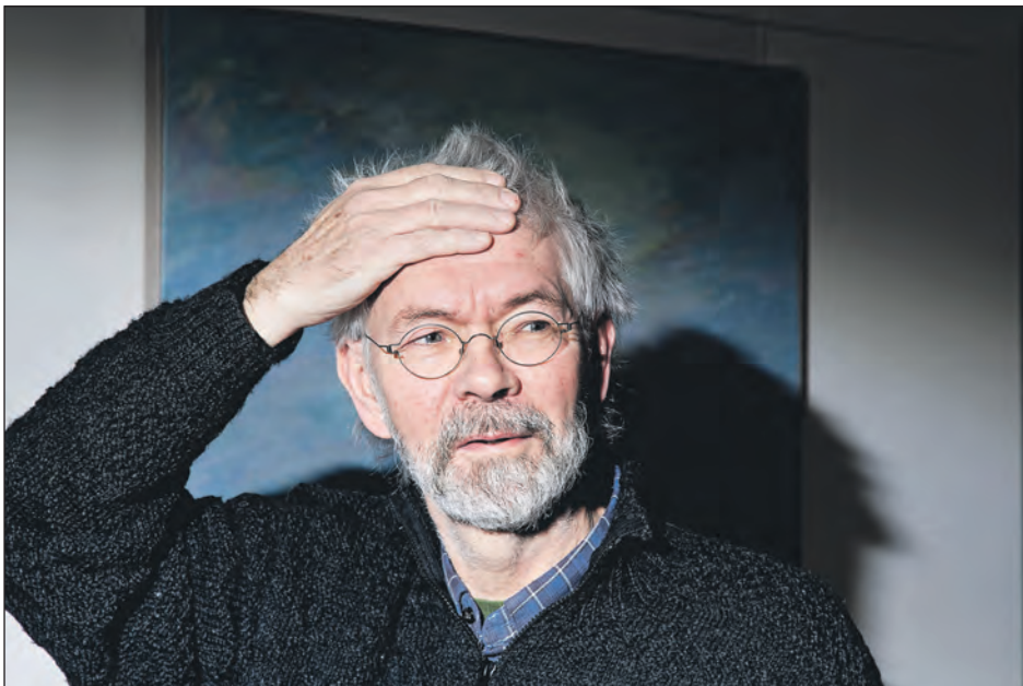
– Det er da noget uhyggeligt noget, siger den sønderjyske maler, som så han sine egne malerier for første gang.