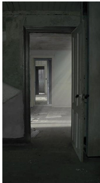
Forgotten Rooms; single-channel video installation. 5 min HD 2016 Støttet af Statens Værksteder For Kunst

Mit arbejde relaterer sig til spørgsmål omkring overvågning, det uforklarlige og det truende. Jeg arbejder med film ud fra et fortæller-perspektiv, hvor jeg undersøger blikkets position og vores evne til at fortolke det vi ser. I mine projekter ønsker jeg at sætte spørgsmålstegn ved hvem det er der ser, og med hvilket blik.