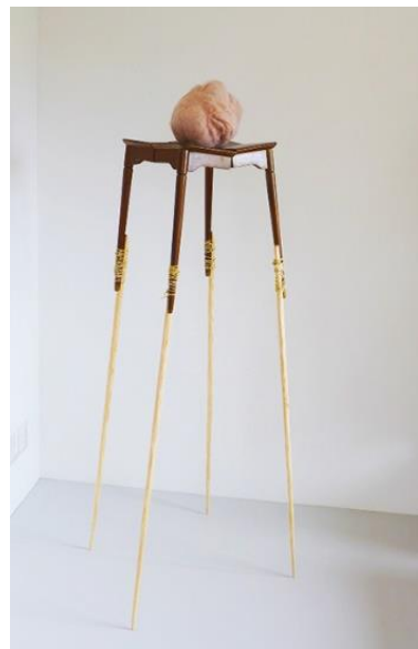
An interior; tekstil, tråd, træ, snor, latex, skammel, klips. 160x65x65cm 2016

En kvinde står ved et vindue, en skål er placeret på en skænk, en stol står i en gennemgang. Det er de enkelte elementers placering i rummet og deres indbyrdes forhold, som optager mig i Vilhelm Hammershøis maleri. Jeg taler om det som "krop i rum". Men malerierne bærer, for mig at se, i høj grad stemninger som på en stilfærdig måde fortæller os om følelser.