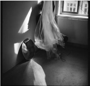
Efter Spurvekjul #1 og Efter Spurvekjul #2; Analogt fotografi. Variable mål. 2016