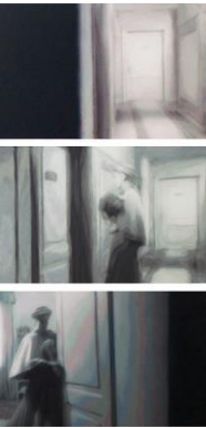
Uden titel (Gertrud, Carl Th. Dreyer 1919); olie på lærred. 180x270cm 2016

Jeg arbejder ud fra egne fotografier eller med udgangspunkt i stills fra film. Til denne udstilling har jeg taget afsæt i mit foto af spejlet i udstillingsrummet på Kalundborg Museum og refererer dermed tilbage til de malerier Hammershøi har malet her, eller jeg har anvendt stills f.eks. fra film af Dreyer, inspireret af Hammershøi. Jeg fortsætter Hammerhøis dialog i spændingsfeltet mellem maleri og virkelighed. Motiv, konturer og overflader opløser sig, for i stedet at fremstå som antydninger, der ligner fjerne erindringsbilleder eller drømme. Præciseringen af billedet sker gennem en mental rekonstruktion. Dette afspejler mit fokus på forbindelsen mellem figur og baggrund, repræsentation og abstraktion, og min interesse for forholdet mellem virkelighed og illusion, eller rettere virkeligheden som illusion.